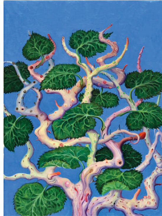
Concetto spaziale , 2024 olio su tela, 40 x 30 cm