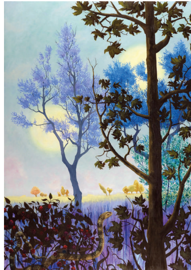
Violet , 2024 olio su tela, 50 x 70 cm