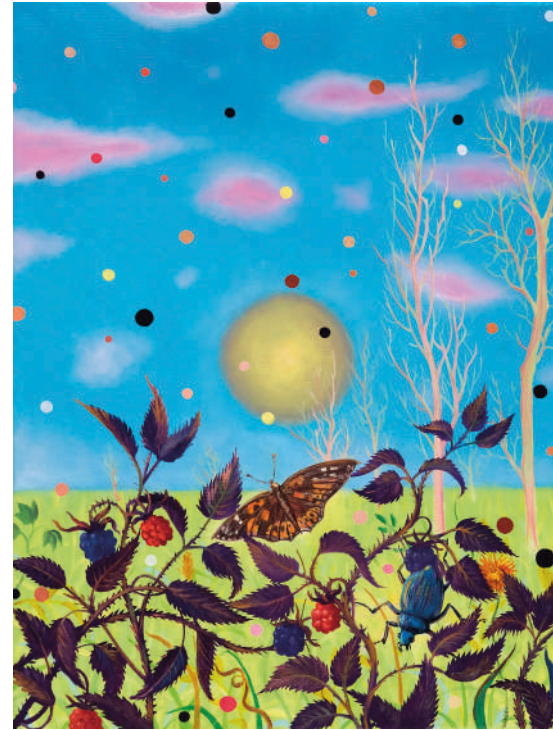
Gomitolo , 2022 olio su tela, 70 x 100 cm